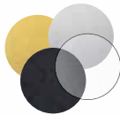
FOILS & SPECIALTY MATERIALS